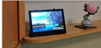
パンフレットの設置も大歓迎です

皆さんのお店で白岡PRビデオや写真のスライドを流してみませんか？ コンテンツはデジタルデータで用意いたします。お気軽にご連絡ください。