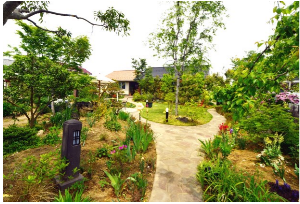
黒須(篠津 横宿) ガーデン

第11回オープンガーデン白岡は 2022年4月・5月に開催予定です。 4月に発行するガイドマップを参照ください。