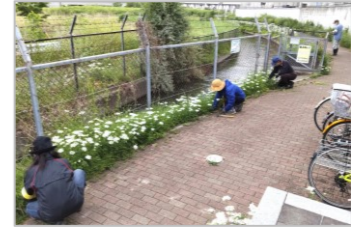
篠津伏越付近にて