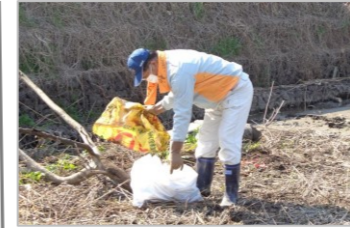
藤井会長(市長)も参加!