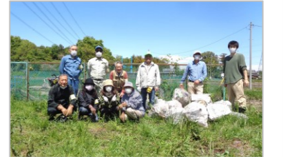
爪田ヶ谷地区にて