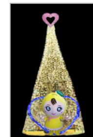
白岡駅西口クリスマスツリーにもハート型イルミネーションを設置します。