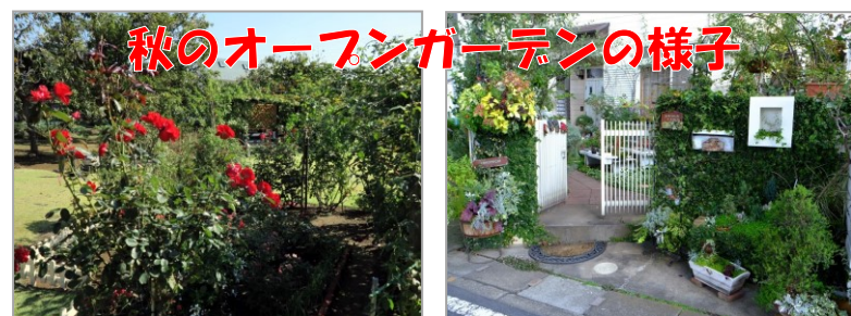
秋のオープンガーデンの様子