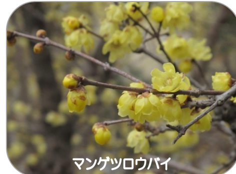
マンゲツロウバイ