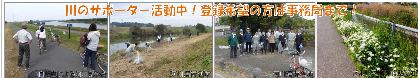
川のサポーター活動中！登録希望の方は事務局まで！